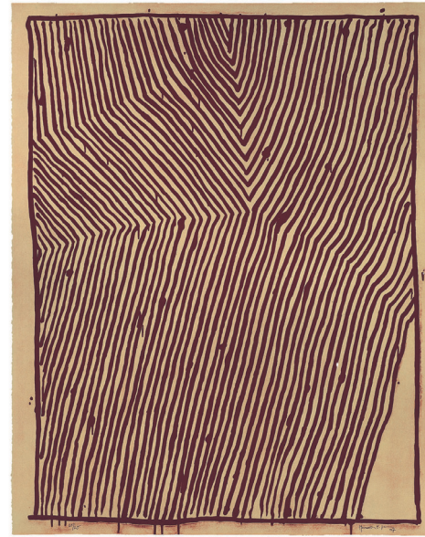
Joan Hernández Pijuan, Del jardín XVIII , 1997 (aguatinta).