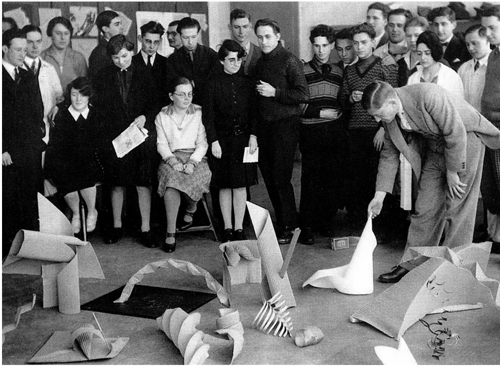
Josef Albers con sus alumnos del Curso Preliminar del Bauhaus, 1928.

Es evidente que, con frecuencia, estos elementos no están ahí al comenzar un proyecto, cuando intentamos hacernos una imagen del objeto que estamos pensando. La mayor parte de las veces, la imagen es incompleta al comienzo del proceso del proyecto, de modo que nos esforzamos por volver a concebir y clarificar una y otra vez el tema de nuestro proyecto, a fin de que las partes que faltan encajen en nuestra imagen. O, dicho de otro modo: proyectamos. La clara y concreta perceptibilidad de las imágenes que representamos nos ayuda a no perdernos en la esterilidad de abstractas hipótesis teóricas, a no perder el contacto con las cualidades de concreción de la arquitectura. Nos ayuda a no enamorarnos de la calidad gráfica de nuestros dibujos y a no confundirla con lo que constituye realmente una cualidad arquitectónica.