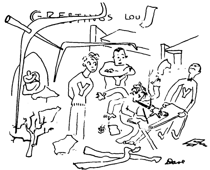
Felicitación navideña a Lou Kahn, visto por uno de sus compañeros de la universidad de Yale, 1947.