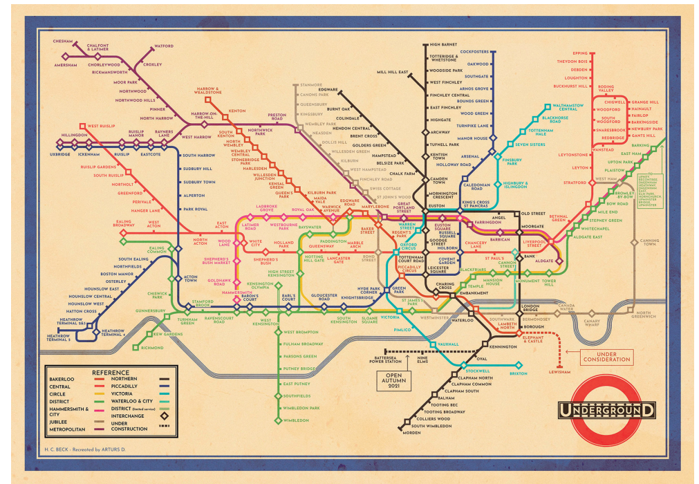
Harry Beck, London Underground Map, 1933.

ANCIANO: El mapa crea Francia. Borra las diferencias. En la escuela, colgada de la pared, Francia en un solo color, para que el niño aprenda de quién es súbdito. Este mapa es un triunfo de la razón y del rey. El mapa hace visibles unas cosas y oculta otras, da forma y deforma. Si un cartógrafo te dice «soy neutral», des confía de él. Si te dice que es neutral, ya sabes de qué lado está. Un mapa siempre toma partido. ¿Por qué en Versalles, después del rey, el hombre más importante era su cartógrafo? ¿Por qué fue quemado Mervetius? Ortelius de Amberes, Mercator de Rupelundo, todos ellos fueron peligrosos y vivieron en peligro. En éste, el centro del mundo es Atenas; en éste, Jerusalén. Estos dos representan el mismo lugar, pero fíjate cómo lo llaman los checos y cómo los alemanes. Éste es el México que encontró Cortés según lo veían los indígenas; los españoles lo veían así. El primer mapa de la India. La India es un invento de los cartógrafos británicos, es un mapa militar, lo que importa son los puntos para someter el territorio. En éste, África pide