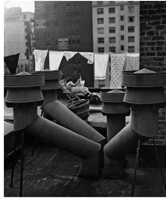
André Kertész, Chimneys, West 20th Street , 1943.