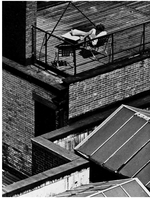
André Kertész, Greenwich Village, New York , 1970.